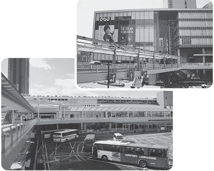
〈完成した広島駅のペデストリアンデッキ〉

また、決算特別委員会に先立つ、水道事業、下水道事業、安芸市民病院事業の3件についての決算認定も行われました。また、定例会最終日には平成27年度広島市各会計歳入歳出決算の審査を行う決算特別委員会が設置され、10月6日から26日まで分科会方式で審査を行った後、最終日に討論・採決が行なわれました。11月2日には第4回臨時会を開いて平成27年度分の各会計歳入・歳出決算について認定することが議決されました。