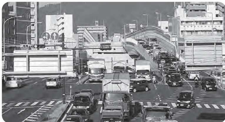
③ 東側から西側を見た国道2号線

同様に地元経済界も同調し、広島商工会議所など11団体と企業16社でつくる「西広島バイパス都心部延伸事業促進協議会」を設立しました。こうしたことは、これまでの広島市に比べて大きな転換点になると期待しており、さらなる地場経済の発展が経済効果の押し上げになると見込まれます。皆さん、岡山や山口と比べてみて下さい。