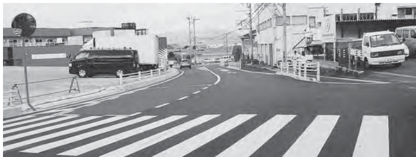
② 山田、美鈴が丘団地側から見た拡幅部分