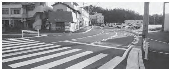
① イオン予定地側から見た拡幅部分と山田団地入口交差点

私が初当選以来、地元の皆様との懸案事項でした。地権者や近隣住民の協力を得ましたが20年を費やしました。公図が混乱し登記簿など権利区分が不明確な上、用地取得に手間取り地権者との協議は一時棚上げされた時期もありました。私は平成24年の決算特別委員会での議論で「早期整備に努めてまいります」との答弁を引き出し、それから一気に進みました。特に近年の3地区協議会(山田町、山田新町、美鈴が丘)を結成してからは、この5年で早期整備を実現しました。