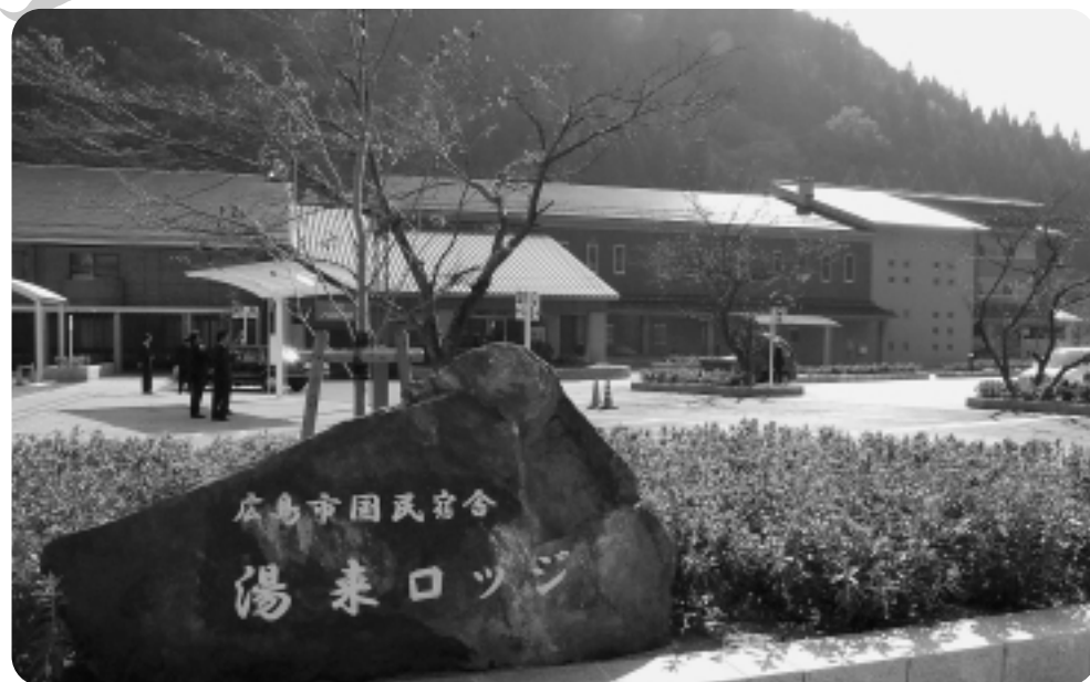
待望の「湯来ロッジ」がリニューアルオープンしました

春から変化がない中でこの予算を一部とは言え執行させるといふ主要会派の中途半端な対応に疑問を感じる結果となりました。