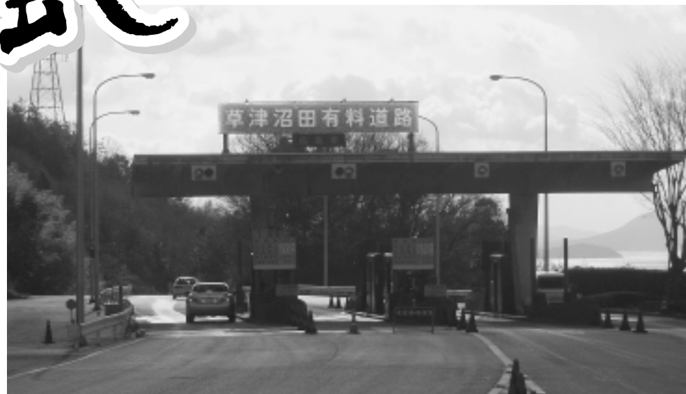
無料開放される草津沼田有料道路

今年が皆様にとってご健勝で幸多い一年となりますよう心からお祈りいたしております。 謹白