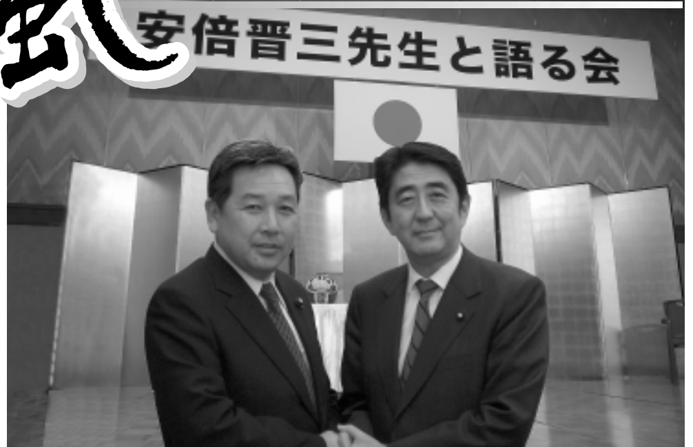
「安倍晋三先生と語る会」リーガロイヤルホテルにて